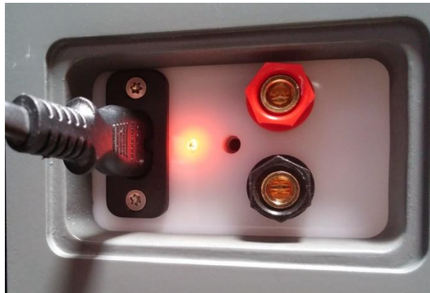
Grafik 2: Eins von 2 Anschlussfeldern

aus Sicherheitsgründen notwendig. Der geschulte Fachhändler wird den für Ihre Bedürfnisse erforderlichen Anschlussbereich einrichten. Versuchen Sie bitte nicht selbst den Umbau vorzunehmen, wenn Sie fachlich nicht versiert sind. Betreiben Sie Ihre ESL HOME nie ohne Abdeckung.