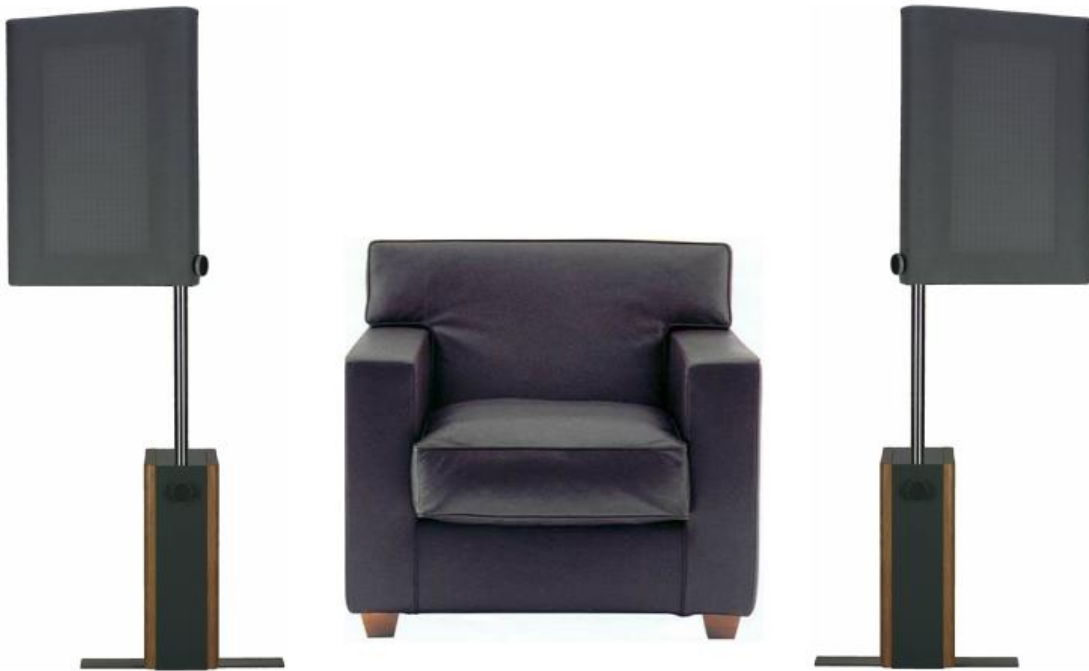
Grafik3: Aufstellung am Hörplatz (Einzelplatzvariante)

Elektronikgehäuses parallel zu Ihrer linken und rechten Seite aufgestellt. In dieser Weise wird wenig Wohnraum „zugestellt“ (s. Grafik 3 ). Das Kabel-Anschlussfeld befindet sich nun auf der in Richtung Ihrer Zimmerwand orientierten Schmalseite (Werksausführung). Schieben Sie Ihre ESL HOME nun so weit nach vorn und zur Seite, dass Sie die unter Punkt 4. beschriebenen Hörabstände und Winkeleinstellungen vornehmen können.