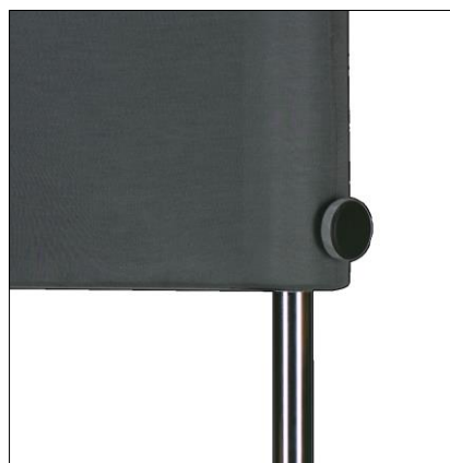
Grafik 5: Handrad am Kopf

Die optimale Hörposition bezogen auf die Höhe, befindet sich mittig vor dem Schallwandler. Damit Sie auf verschiedenen Sitzmöbeln Ihre Mittenposition einrichten können, ist der Lautsprecher-Kopf höhenverstellbar ausgeführt. Sie finden auf der Rohrseite am Kopf ein Handrad. Durch links drehen wird es gelockert. Nun können Sie den Kopf mit beiden Händen anfassend nach oben bzw. unten bewegen und anschließend durch rechtsdrehen sichern. Der Verschiebebereich beträgt ca. 20 cm. (s. Grafik 5).