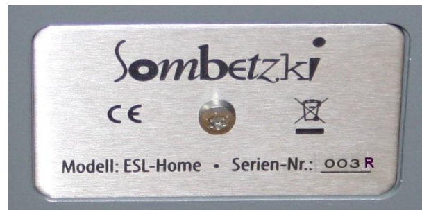
Logoabdeckung: 2. Anschlussfeld