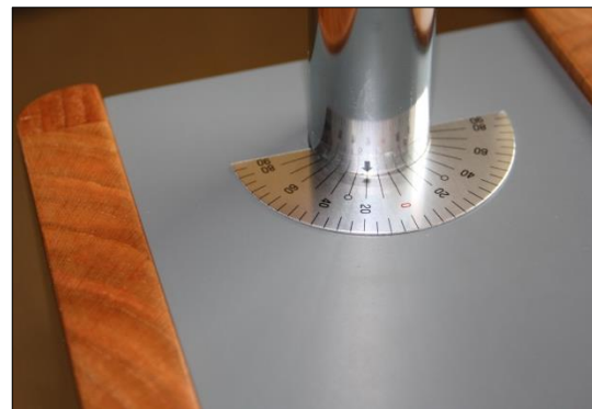
Grafik 7: Einstellhilfe Winkelskala