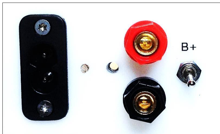
Grafik 8: Bassanhebung

Die Wiedergabeintensität der tiefen Frequenzen hängt von der Aufstellung (s. Kap. 4 ff) und vom verwendeten Verstärker (z.B. Röhren- oder Transistorverstärker) ab. Mit Hilfe des an einem Anschlussfeld verbauten Schalters lässt sich der Bass im Bereich von 40 bis etwa 70 Hertz um 3 dB anheben (B+ Stellung).