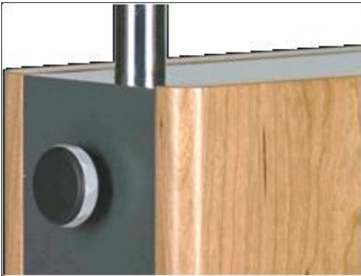
Grafik 6: Handrad am Elektronikgehäuse

die Rohrachse schwenken. Damit ist das (in Punkt 4 erwähnte) Einwinkeln des Schallwandler auf Ihre Ohren möglich. Probieren Sie verschiedene Winkelstellungen aus. Der Maßstab ist dabei Ihr persönlicher „Geschmack“. Allerdings ist dabei zu beachten, dass beide „Köpfe“ mit annähernd gleichem Winkel zu Ihnen stehen. Lesen Sie dazu auf der Winkelskala am unteren Rohrende den eingestellten Winkel ab und stellen den gleichen Wert am zweiten ESL-Home ein (s. Grafik 7 ).